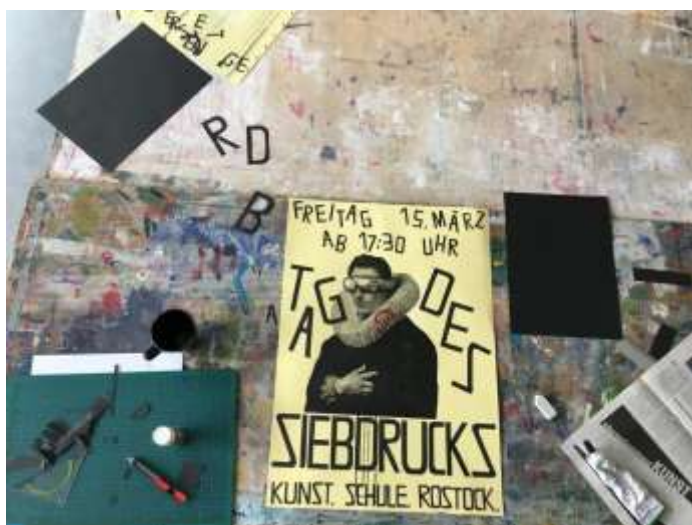
Abbildung 3: Erstellen eines Plakates