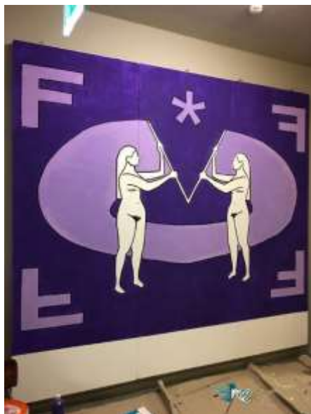
Abbildung 1: Gestaltung eine Banners zum Frauenstreiktag