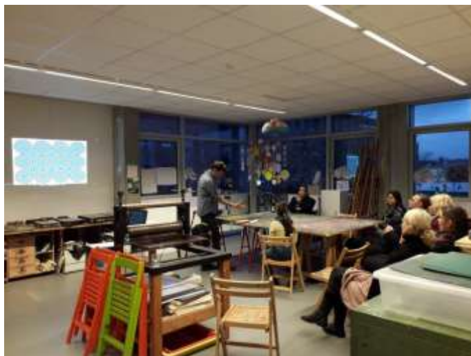
Abbildung 2: Teilnahme und Begleitung des Vorstudiums